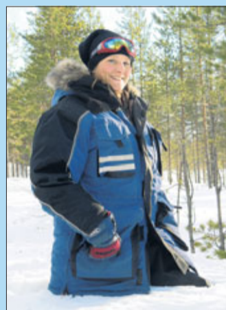
Abseits der gespurten Trails versinkt man schnell im Schnee.

In dem grellen Weiß mit den glitzernden Schneekristallen verliert man jegliches Zeitge-